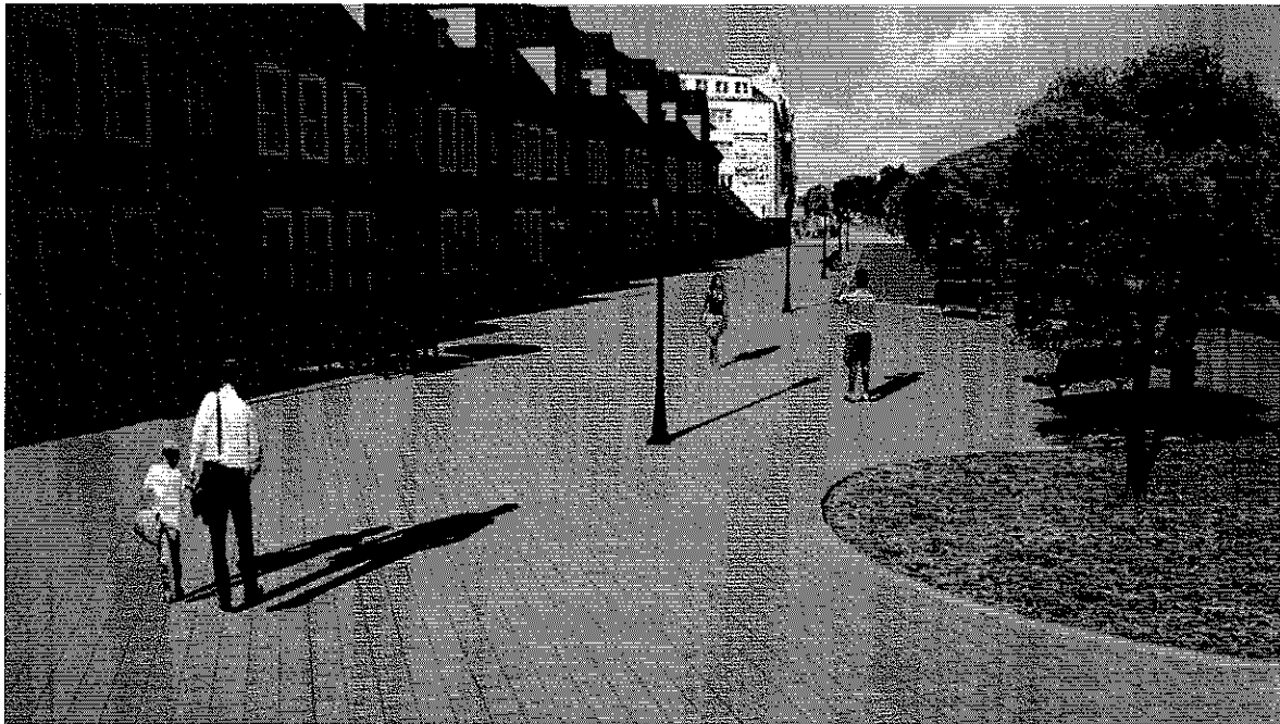
Wizualizacja omawianego odcinka. Widok w kierunku Placu Żołnierza Polskiego i "Alej Kwiatowej"