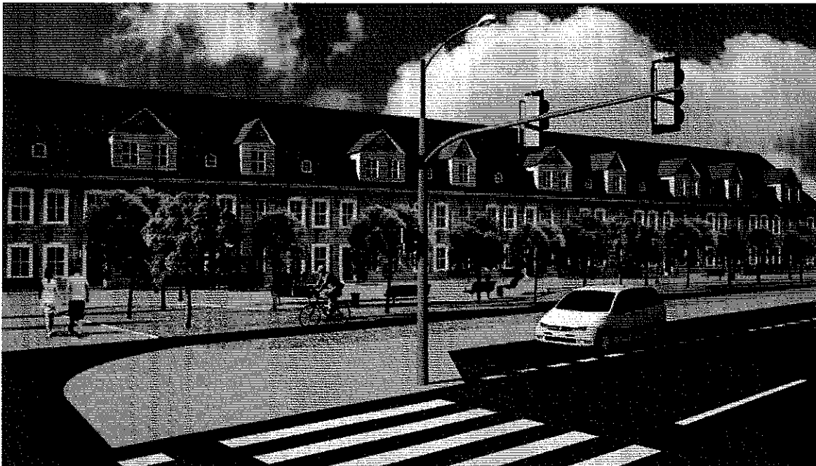
Widok od strony Trasy Zamkowej. Po prawej równoległe miejsca parkingowe.