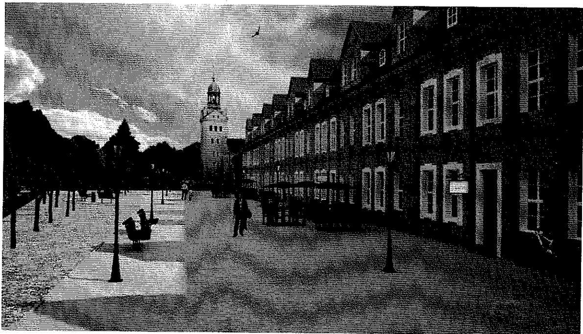
Wizualizacja pasażu pieszego w stronę Zamku Książąt Pomorskich